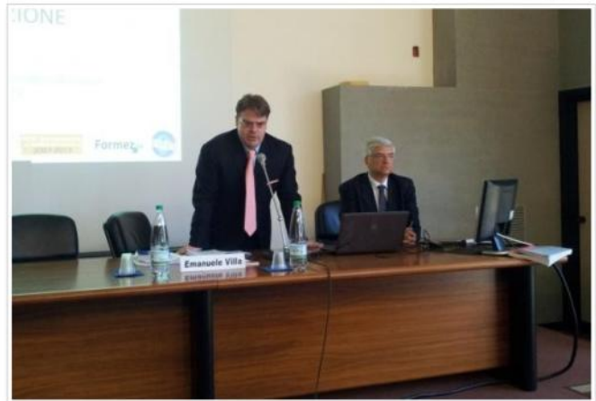
La micro e nano elettronica, le biotecnologie e il settore agroalimentare sono tra le eccellenze siciliane riconosciute a livello nazionale e internazionale nell'ambito dell'innovazione.